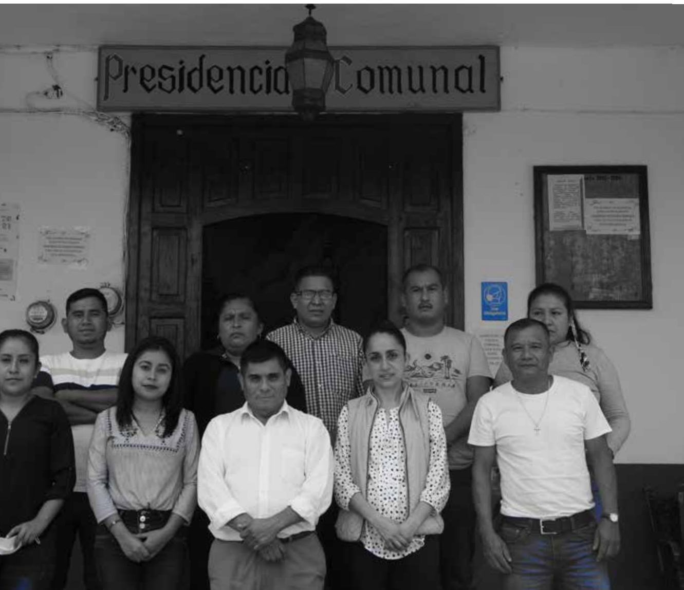
Integrantes del Concejo Comunal de San Ángel Zurumucapio.