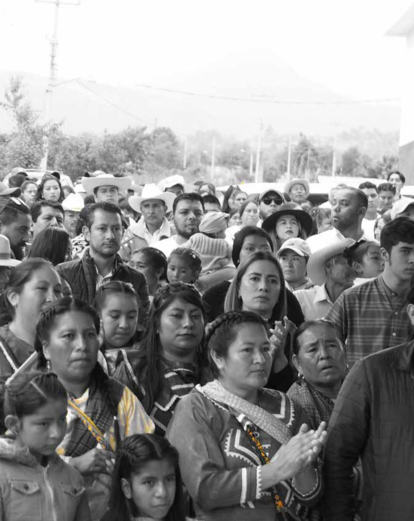
Asamblea en Crescencio Morales, Zitácuaro.