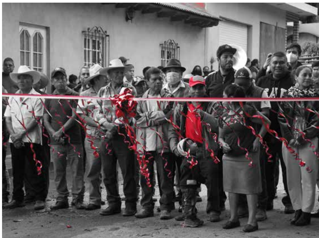
El Concejo Comunal de San Ángel Zurumucapio, municipio de Ziracuaretiro, inaugurando una obra en su comunidad.

Si bien las comunidades indígenas que ejercen autogobierno acceden a funciones y responsabilidades parecidas a los ayuntamientos, no dejan de ser comunidades indígenas y, como tales, tienen el derecho constitucional y convencionalmente reconocido a preservar sus instituciones, sus usos y costumbres, sus formas de organización interna y sus mecanismos de deliberación y toma de decisión. Por tal motivo, la relación que las diferentes dependencias del gobierno de Michoacán establezcan con los autogobiernos indígenas deben tener siempre en consideración estas particularidades de las comunidades e impulsar las reformas legales necesarias para darles plena vigencia a sus derechos en un marco de interculturalidad.