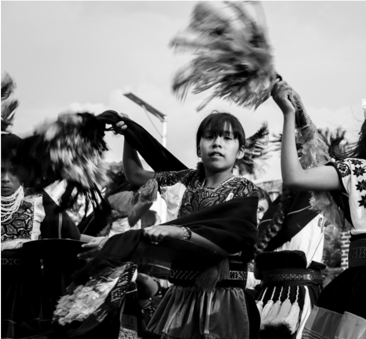
Niñas de la comunidad de La Cantera, municipio de Tangamandapio, bailando la Danza de la Pera para la Feria de la Pera que se realiza en su comunidad.