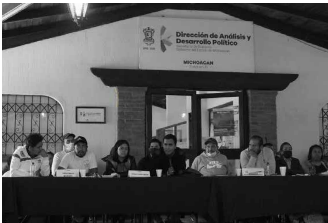
Comunidades integrantes del Frente por la Autonomía en reunión con la Secretaría de Gobierno del Estado de Michoacán.

E s importante informar a las autoridades de las comunidades que ejercen su autogobierno de las implicaciones que cada programa tiene en cuanto a generar obligaciones y deberes entre las partes que participan. Particularmente, es necesario informar a qué se obliga la comunidad y si se compromete su autonomía.