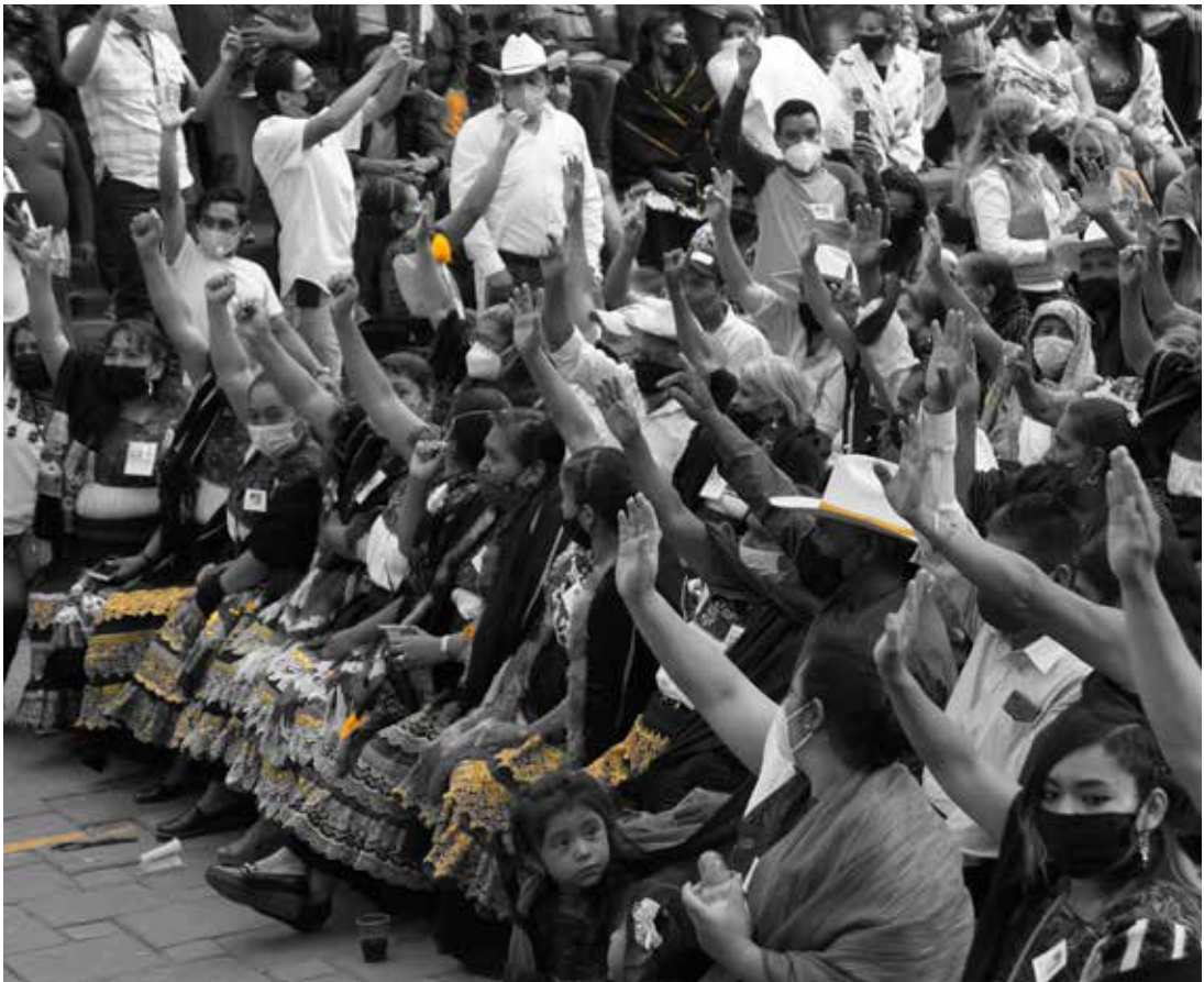
Consulta previa, libre e Informada llevada a cabo en la comunidad de La Cantero, para elegir si desean ejercer su presupuesto de manera directa.

La segunda razón es que la LOMM establece como parte del procedimiento para que las comunidades indígenas puedan ejercer su derecho humano al autogobierno, la realización de una consulta previa, libre e informada. En el Estado de Michoacán los resultados de las consultas indígenas son obligatorios para todas las autoridades involucradas, por lo que, si las comunidades manifiestan en consulta su deseo de ejercer el autogobierno y por tanto manejar el presupuesto que les corresponde, es obligación de los Ayuntamientos garantizarlo.