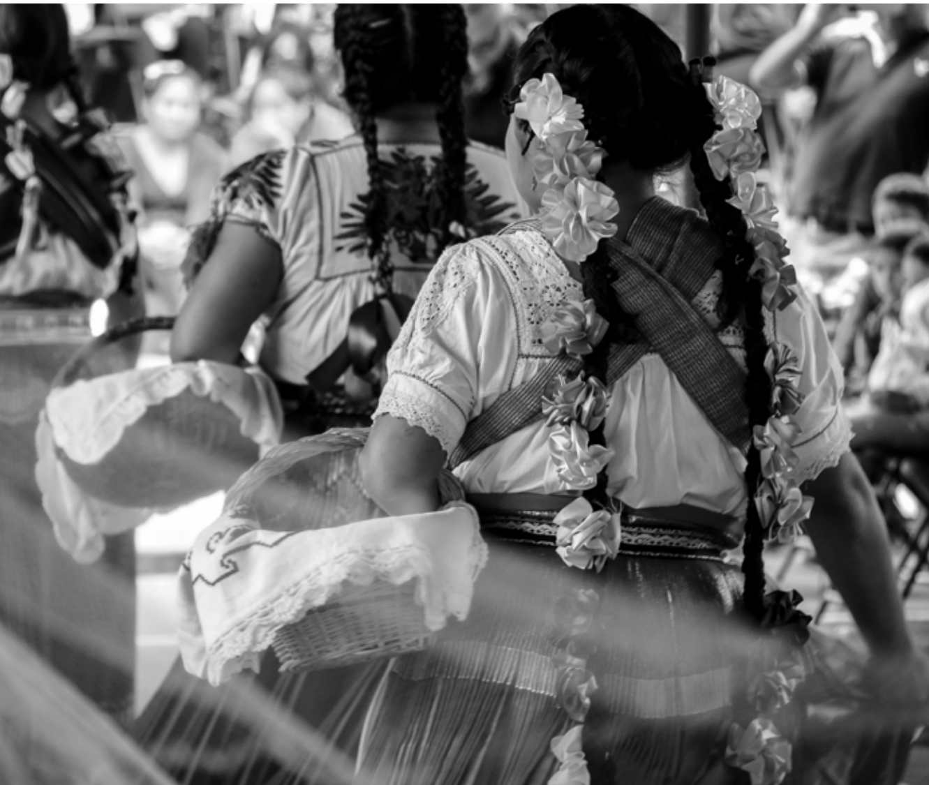
Concejeras de la Isla de Janitzio, municipio de Pátzcuaro, en una presentación de las danzas típicas de su comunidad. El rescate de la cultura ha sido un elemento importante en diversas comunidad que tienen autogobierno.