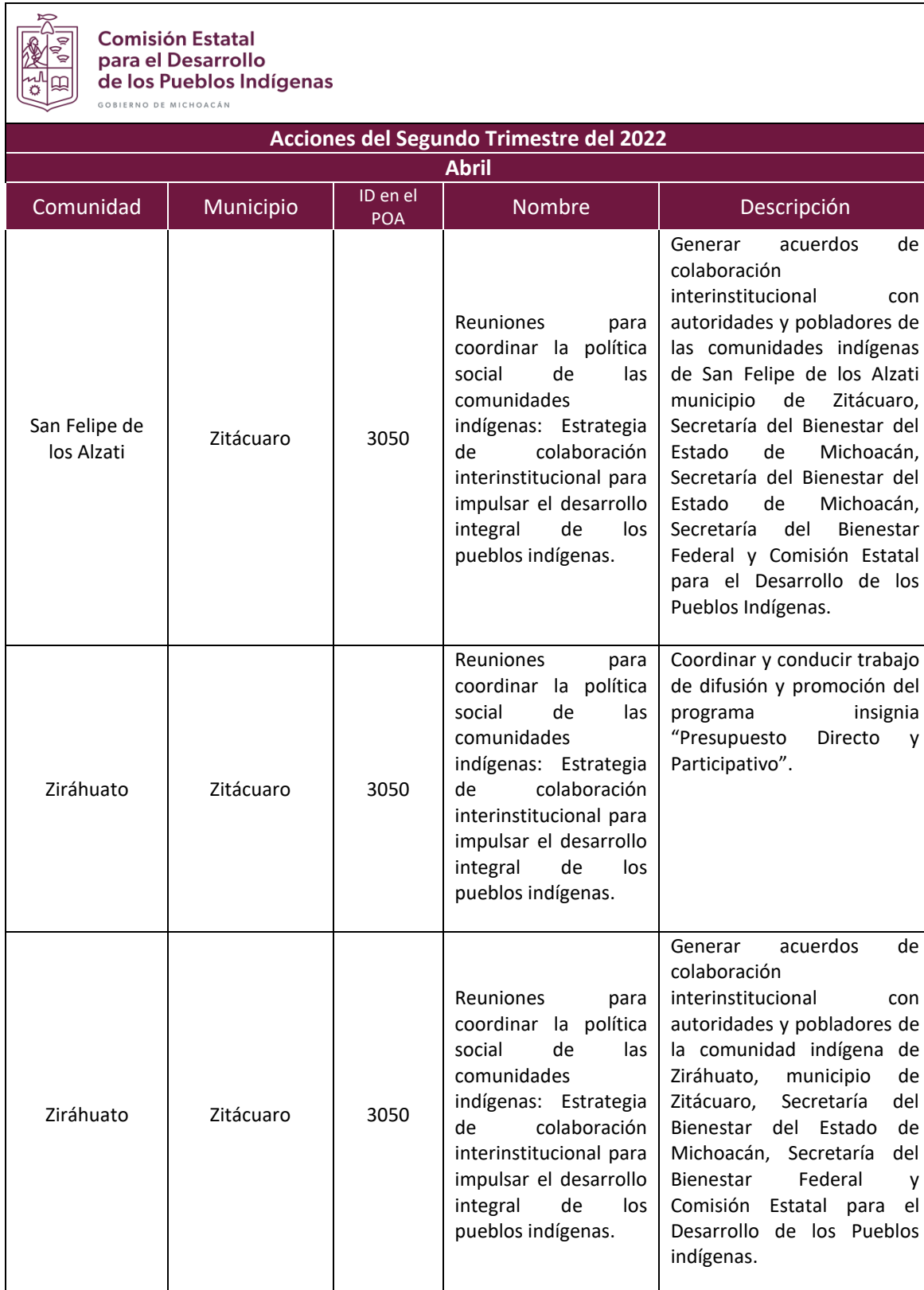
Tabla 1. Acciones de la Comisión Estatal para el Desarrollo para los Pueblos Indígenas.