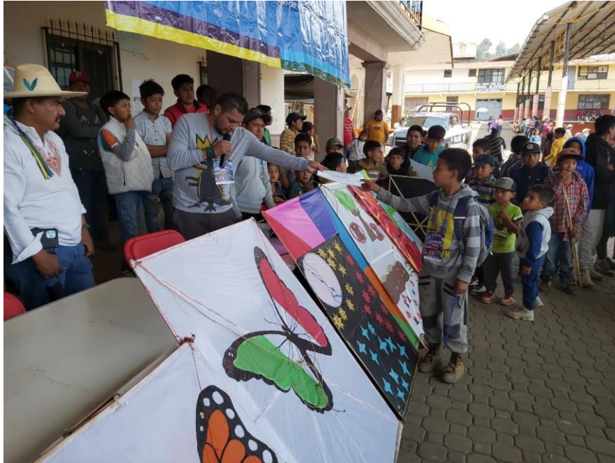
XVI Concurso Regional de "Kantsákata" en la comunidad de Comachuén, municipio de Nahuatzen

En estos rubros también se han gestionado apoyos para diferentes proyectos que reproduzcan las expresiones de los pueblos y comunidades indígenas como es el caso de: “Kanharikua, téskukuaka Taré Uarhahi”, taller de máscara y bordado; “Mascaritas Tocuaro”; y “Artesanías Mintsita”. Proyectos que fomentan la preservación del trabajo de las comunidades en Michoacán.